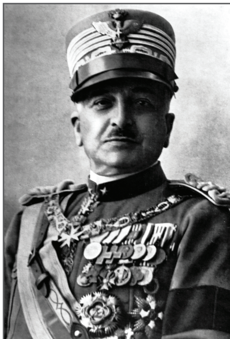
Gen. Armando Diaz

Infatti, subito dopo la Battaglia del Solstizio il Comando Supremo italiano (generale Diaz) sollecitato dal generale francese Foch, iniziò a preparare un piano d'attacco in grande stile sul Grappa e sul Piave. Senza indugio si intensificò l'addestramento delle truppe italiane alla "guerra di movimento", concetto quantomai nuovo dopo quattro anni di immobilismo in trincea. Ma si dette la massima importanza allo sviluppo dell'artiglieria a cui l'indu-