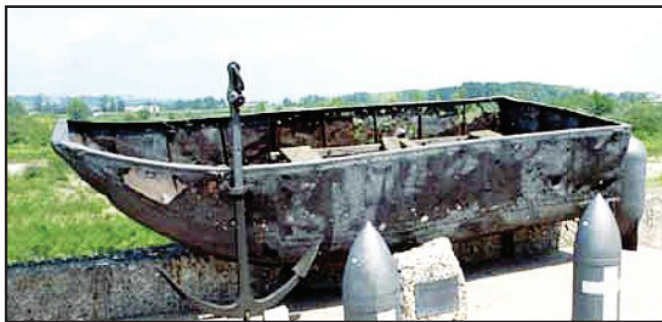
Barca da ponte risistemata a monumento in riva al Piave