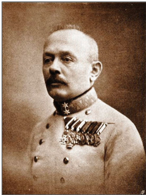
Gen. Svetozar Boroevic von Bojna

Per garantire la massima sicurezza vennero tenuti informati solamente i più alti livelli di comando, avvisando gli ufficiali generali di livello inferiore il più tardi possibile per evitare possibili fughe di notizie.